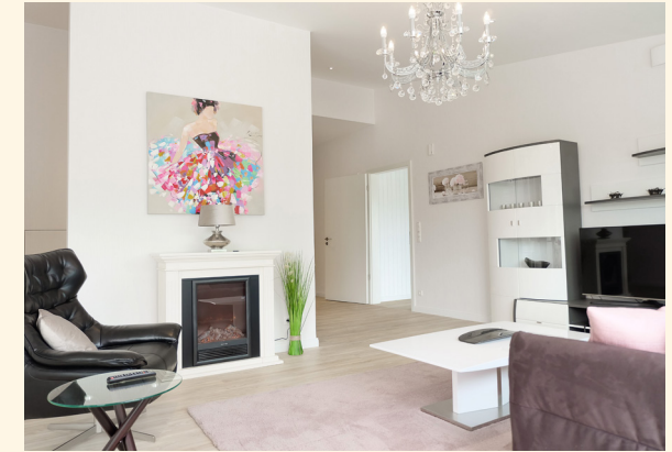
Musterwohnung: Wohnzimmer mit offener Küche