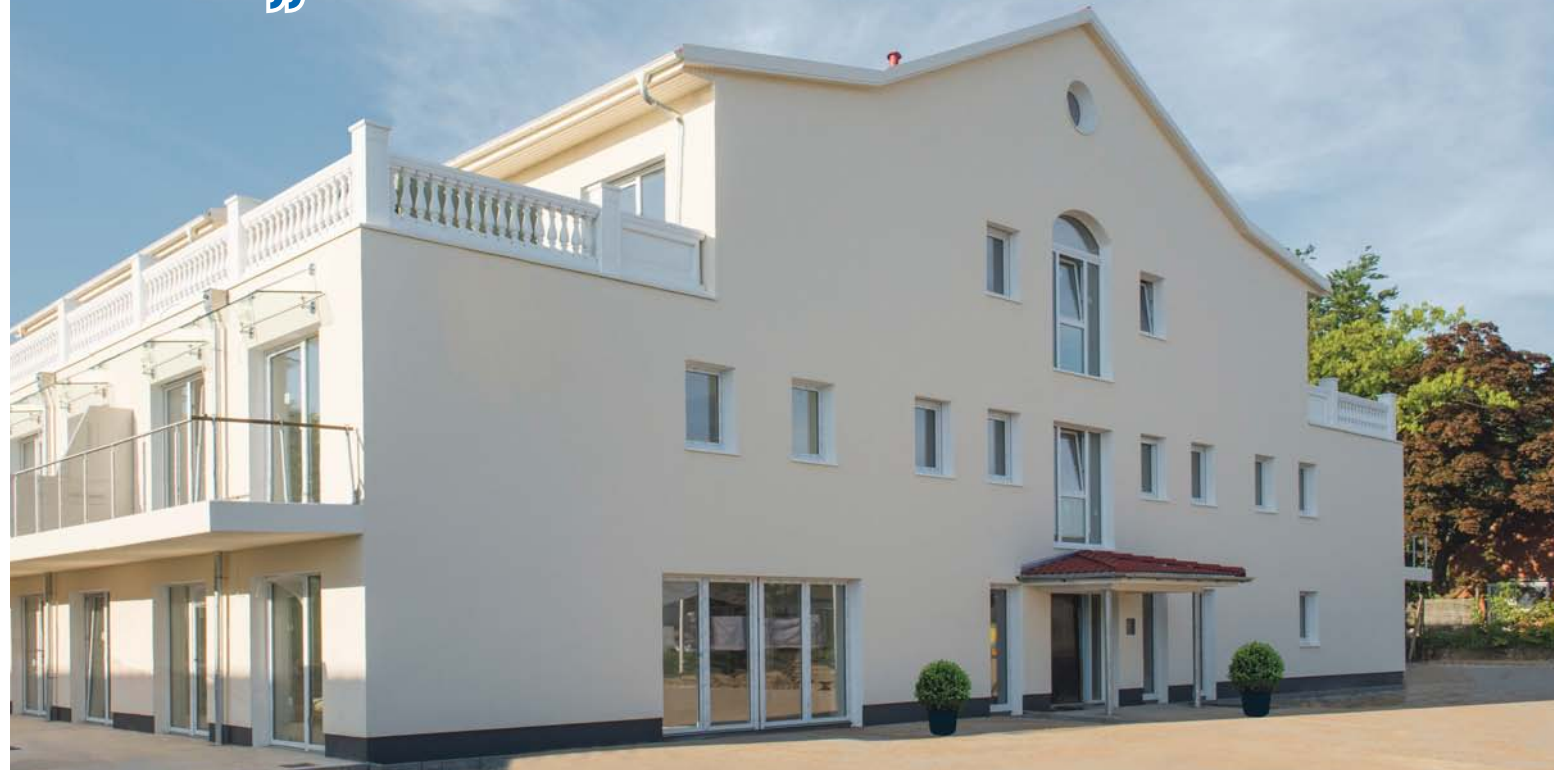
„DANA Lebensstil“ Gebäude